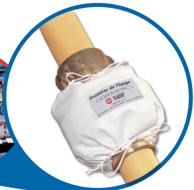
PROTETOR DE FLANGE