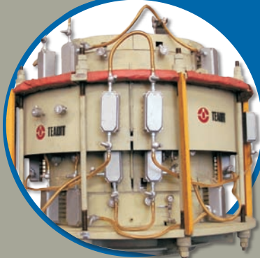
JUNTAS DE EXPANSÃO METÁLICAS - TERMATIC®